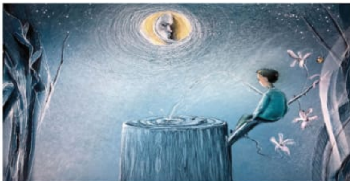
(Illustrazione di Sara de "I terno al lotto")